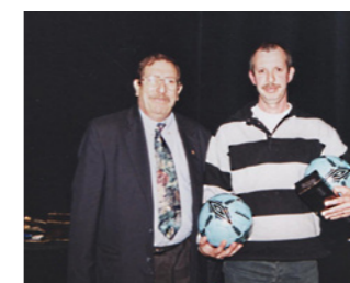
Cérémonie de remise des récompenses sportives, le 17 novembre 2003