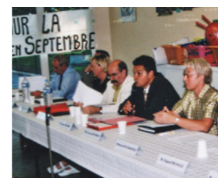
Mobilisation des parents et des élus suite à la fermeture d'une classe à l'école Victoire Lampin, en septembre 2002