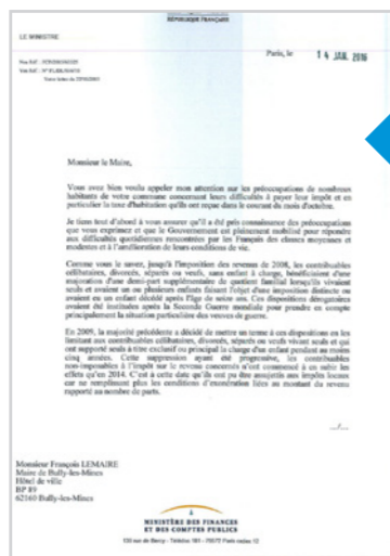
Copie du courrier de Michel Sapin reçu par M. le Maire.

Votre appel a donc été entendu par le Ministère des Finances pour le rétablissement de la demi-part. ▶