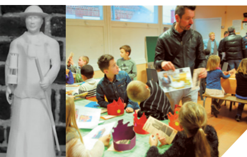
Les enfants (ici à l'école Suzanne Blin) ont découvert le monde des Géants.

Le baptême du Géant Fernand aura bien lieu le 22 mai prochain. Dans le cadre de ces festivités, les enfants des écoles ont commencé à mettre la main à la pâte en ce début d'année 2016.