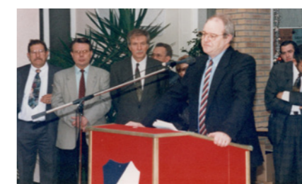
Vœux à la population le 7 janvier 1996