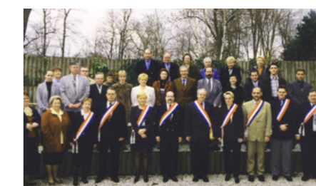
Présentation de l'équipe municipale élue en mars 2001