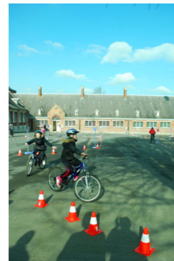
Les jeunes à l'assaut du parcours ici à l'école des Alouettes

Il est fait obligation aux personnes accompagnées d'un chien de procéder par tout moyen au ramassage des déjections de leur animal. Le non-respect de cette règle est passible d'une contravention de 3e classe soit un montant de 68 euros.