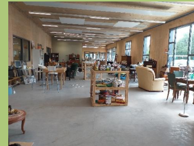
Ressourcerie – Liévin