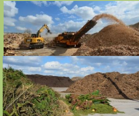
Centre de tri et de compostage des déchets végétaux et des encombrants - Harnes