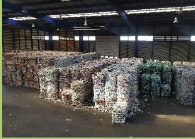
Centre de tri des emballages - Harnes