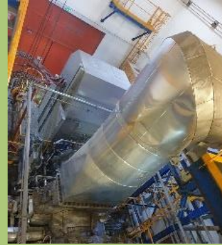
Centre de Valorisation Énergétique – Noyelles- sous-Lens