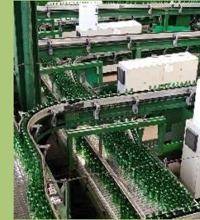
Verrerie – Wingles